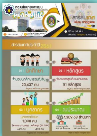
สารสนเทศ เดือน กรกฎาคม 2561

แผนยุทธศาสตร์ มหาวิทยาลัยราชภัฏเชียงใหม่ ฉบับปรับปรุง ปี 2560